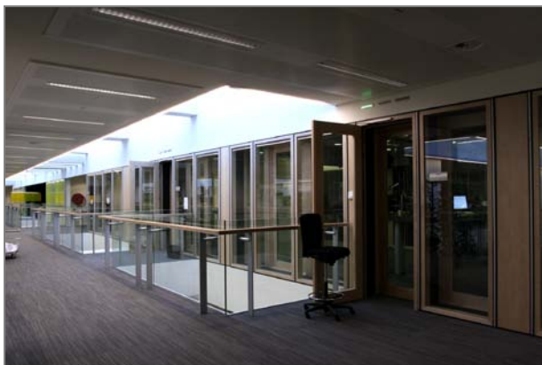
Uitzendstudio's Radio 1: zicht van uit het kantoor

In het nieuwe concept liggen de uitzendstudio's, de montageruimten en de inleescellen vlakbij, zelfs midden in de kantoorzone.