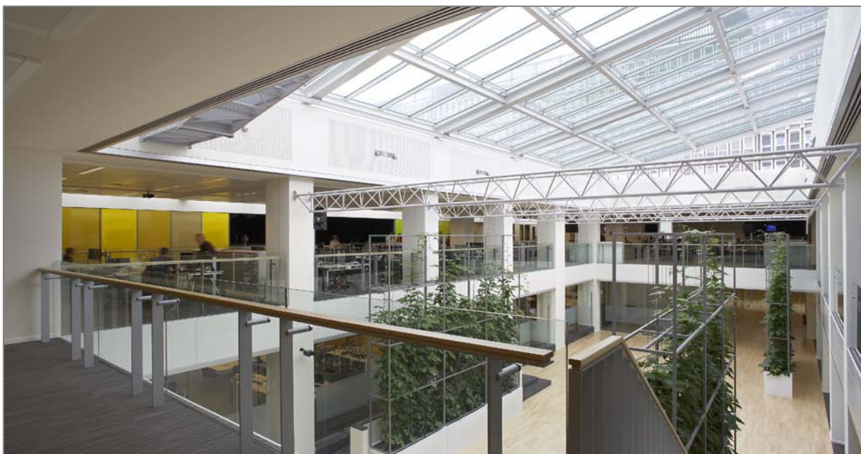
centrale patio, circulatieruimte, daglichttoetreding voor de verschillende kantoor niveaus