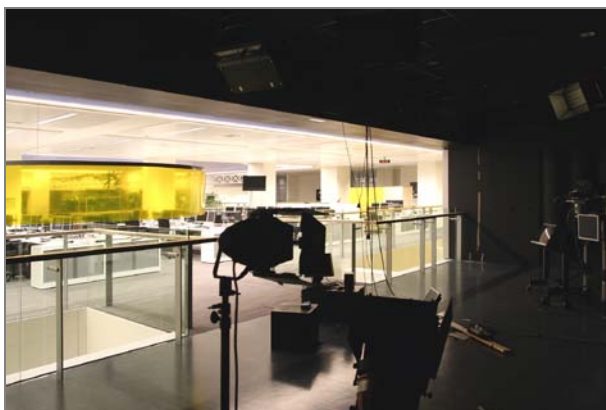
TV studio in (visueel) open verbinding met het kantoor