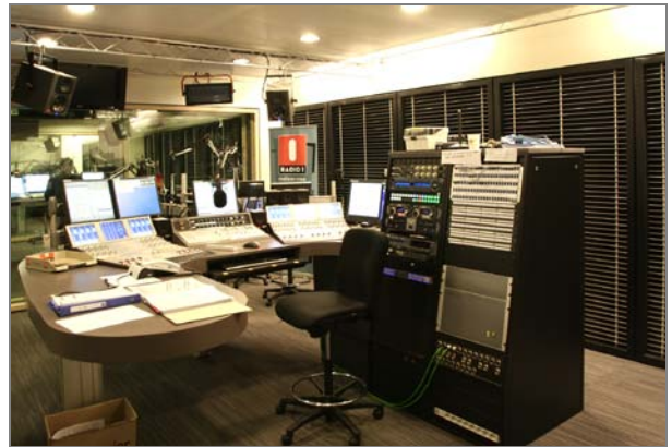
Uitzendstudio's Radio 1: studioruimte