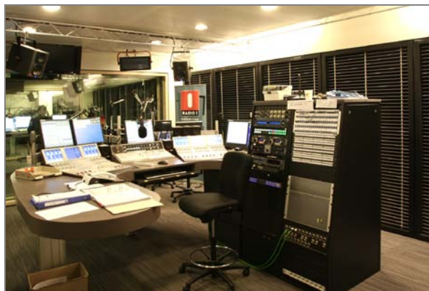
Uitzendstudio's Radio 1: studioruimte

Om dit mogelijk te maken, werd bijzondere aandacht besteed aan de isolatie van geluid en trillingen tussen de kantoorzone en deze geluidgevoelige ruimten.