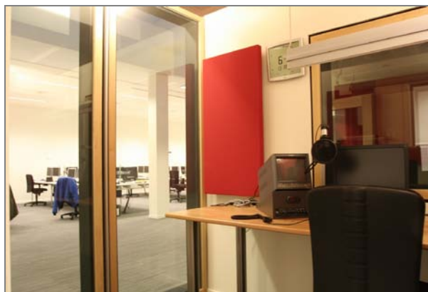
Inlees- en montagecellen (zicht van uit een cel)

Tijdens de werken, waaronder grote afbraakwerken, moesten de bestaande radio- en TV studio's in gebruik blijven. Ook de nieuwe, vlakbij gelegen serverruimte mocht geen hinder ondervinden van trillingen.