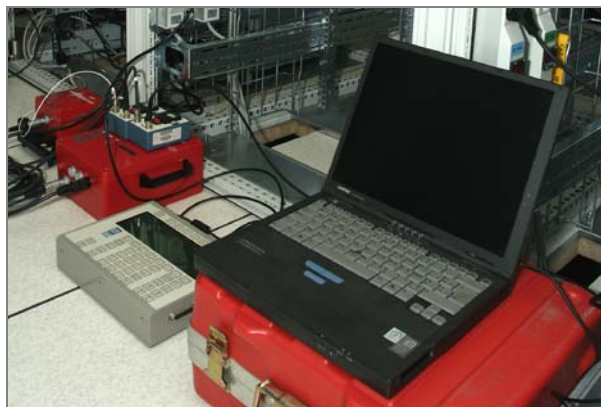
Meetsysteem voor trillingsbewaking: continue registratie, frequentieanalyse, alarmfunctie bij het naderen of overschrijden van grenswaarden